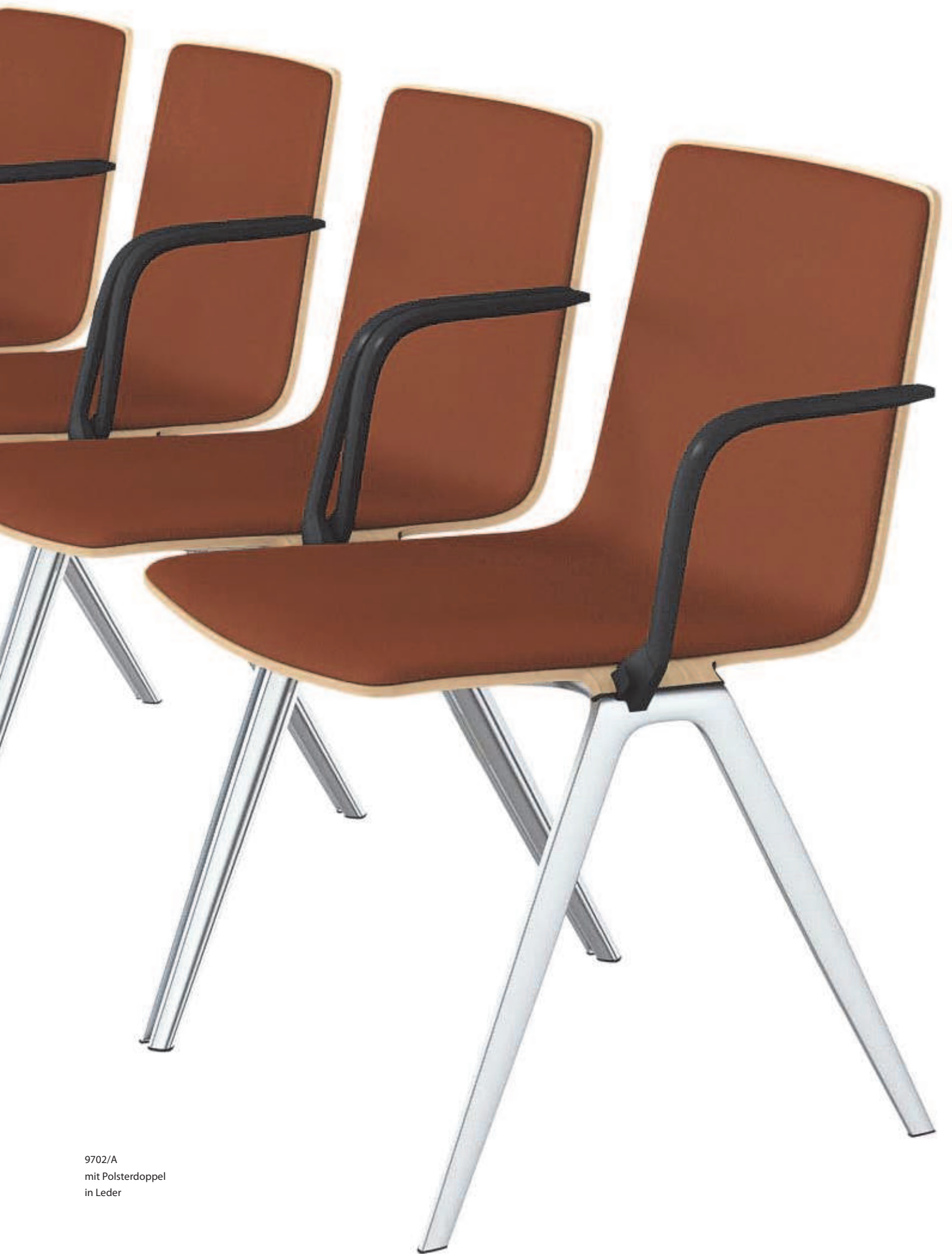
9702/A mit Polsterdoppel in Leder