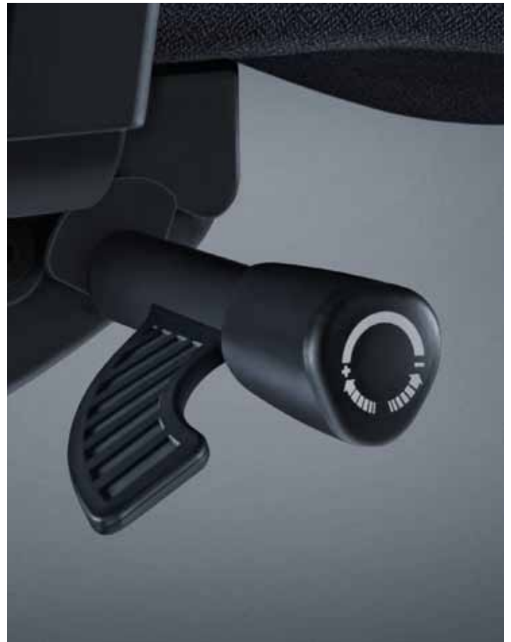
Großer und intuitiv bedienbarer Hebel für Gewichtsregulierung und SitzhöhenEinstellung