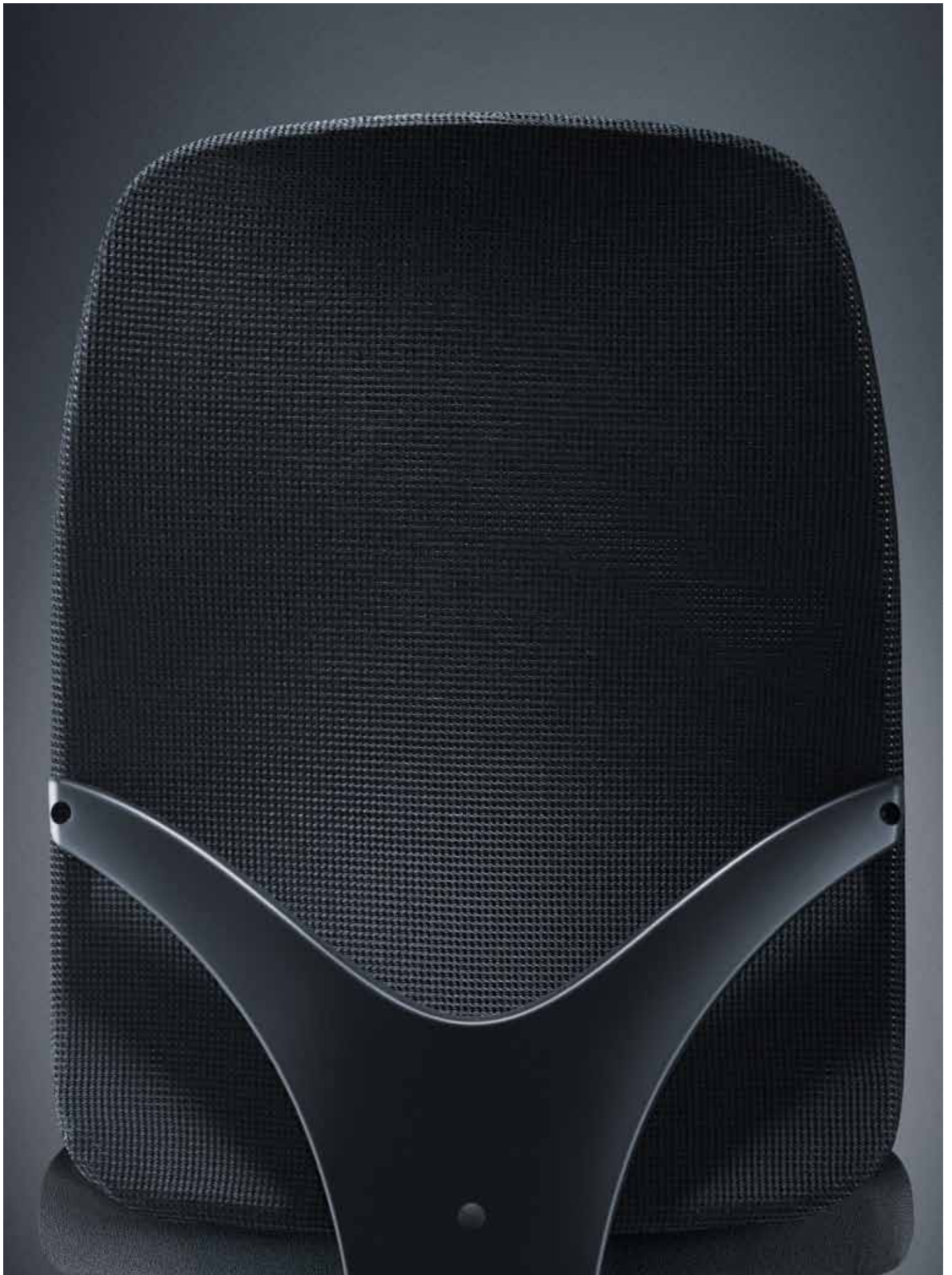
Charakteristisches Merkmal von Geos: die V-förmige Rückenspanne