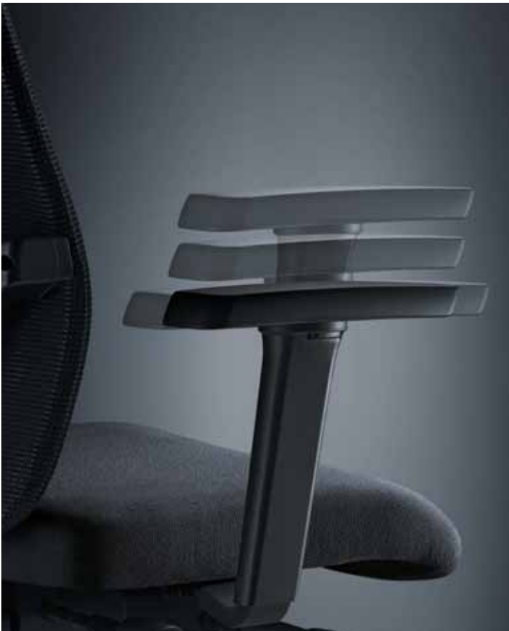
T-Armlehnen vierdimensional verstellbar mit weicher Auflage