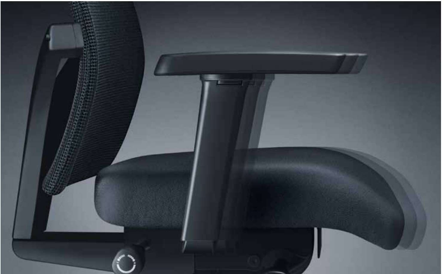
Sitztiefe und Sitzneigung können individuell mit einem Handgriff justiert werden