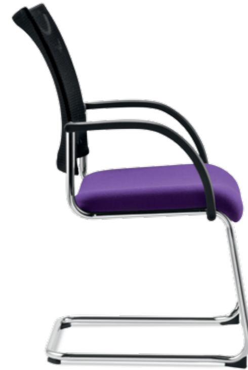
SM 81100 + Armlehnen/Armrests 033

Stackable (up to 3-high) cantilever chair with continuous, ergonomically-shaped backrest ( 45 cm ) and comfortable armrests.