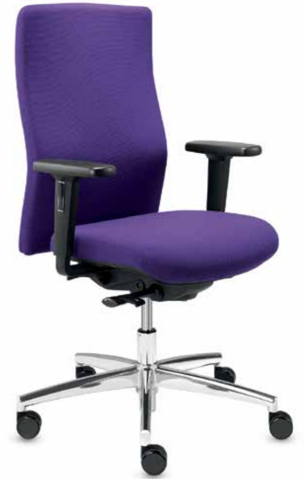
BS+ SM 95835 sim-o S + Armlehnen/Armrests 077

Drehstuhl mit hoher, höhenverstellbarer Vollpolster-Rückenlehne (57 cm) und Ballpoint-Synchron®-plus-Mechanik. Die höhen- und breitenverstellbaren 2F-Armlehnen sorgen für Entlastung im Schulter- und Nackenbereich.