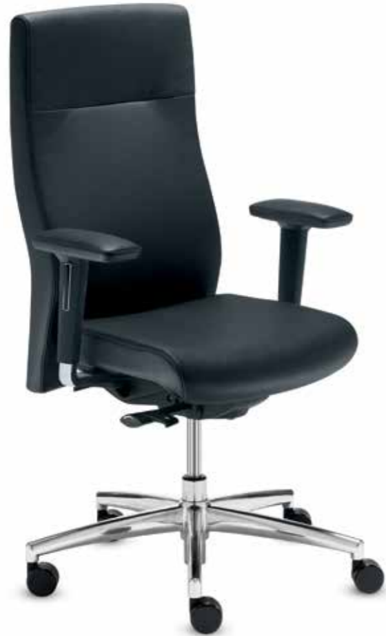
qs+ SM 96365 + Armlehnen/Armrests 173

Drehsessel in Premium-Leder mit multifunktionalen Armlehnen mit Leder-Armauflagen. Die Rückenlehne mit integrierter Nackenstütze ( 70 cm ) ist bequem im Sitzen mittels Easy-Touch-System höhenverstellbar.