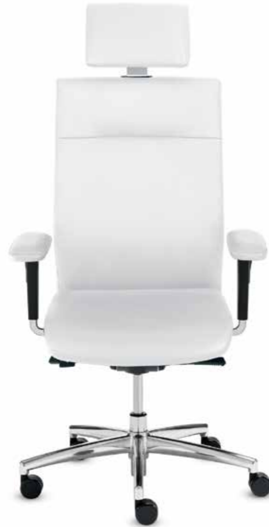
qs+ SM 96395 + Armlehnen/Armrests 173

Executive swivel chair in premium leather with multi-functional armrests with leather armpads. The height of the backrest with the integrated neckrest ( 70 cm ) can easily be adjusted while sitting using the Easy-Touch-System.