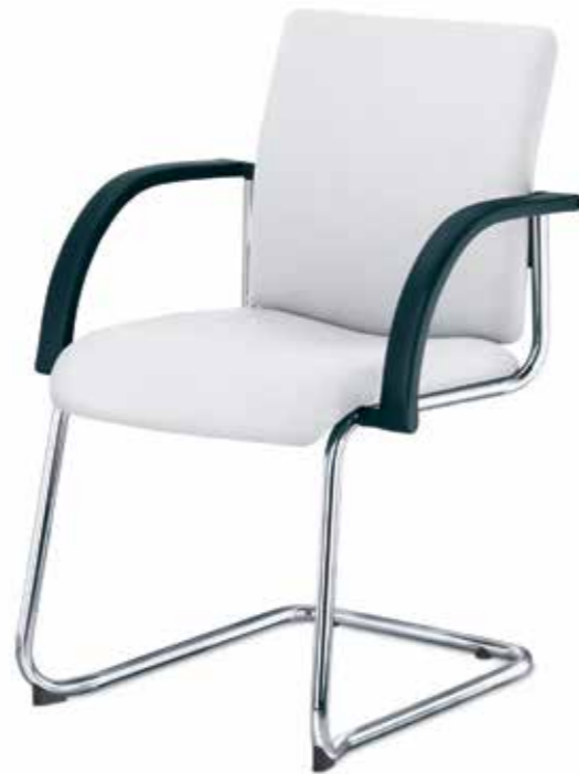
SM 96030 + Armlehnen/Armrests 033

Stackable (up to 6-high) four-legged chair without armrests with continuous, ergonomically-shaped backrest ( 45 cm ).