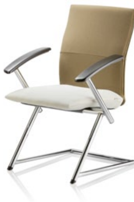
Tiger UP 5 A