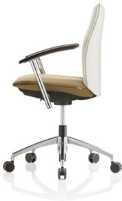
Tiger UP 4 A