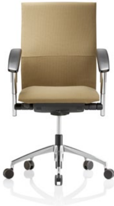
Tiger UP 6 HA