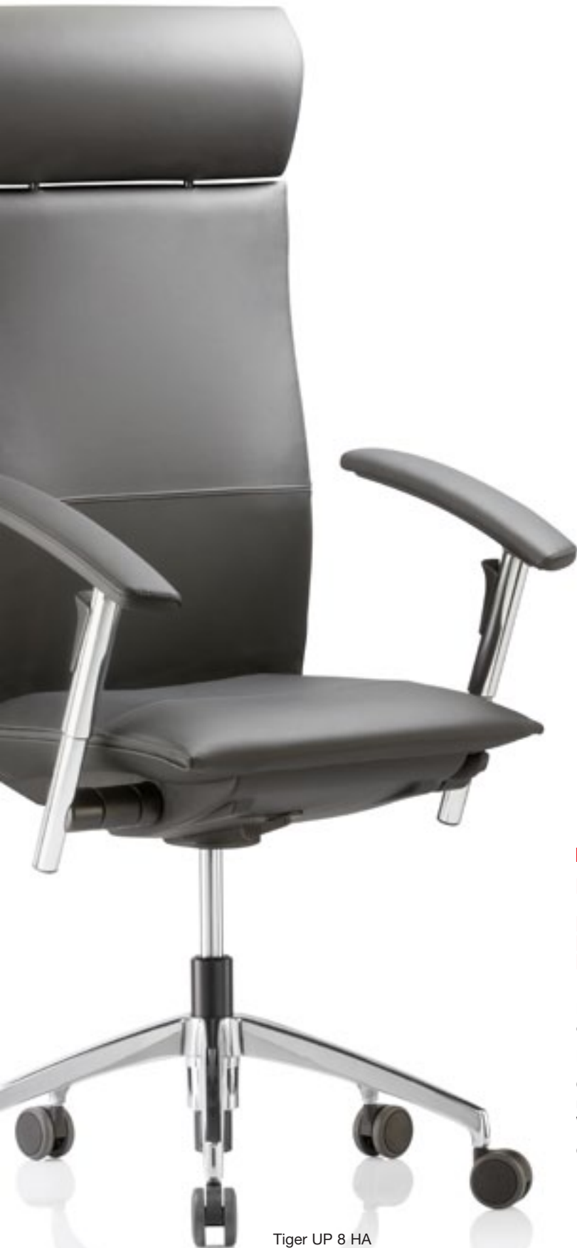
Tiger UP 8 HA