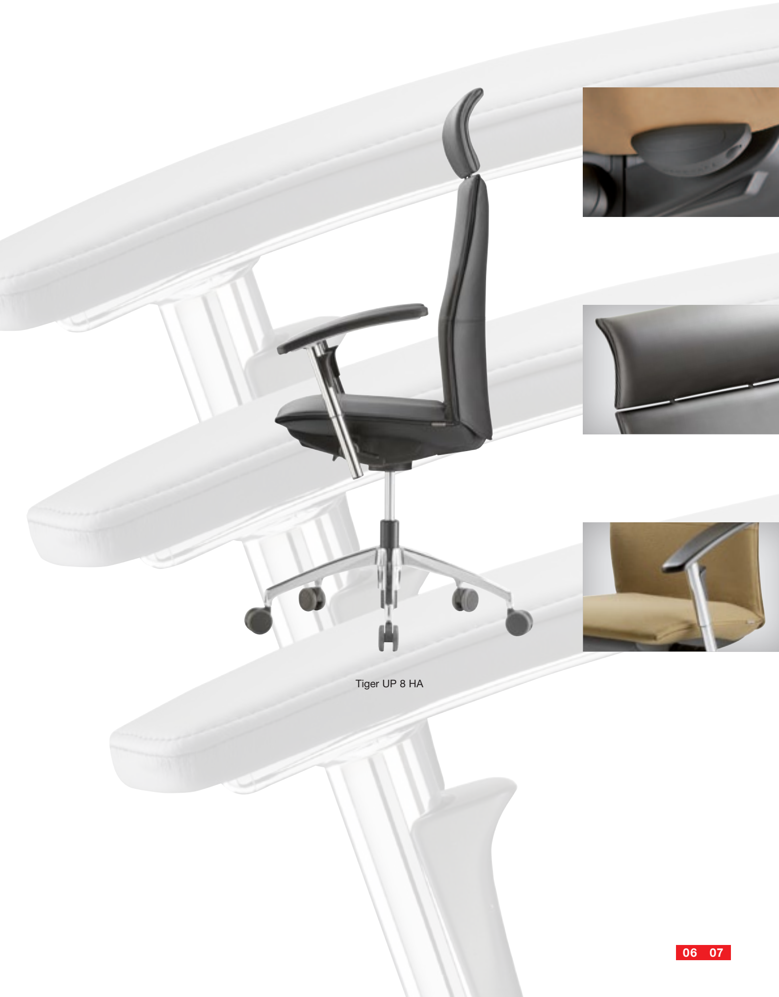
Tiger UP 8 HA